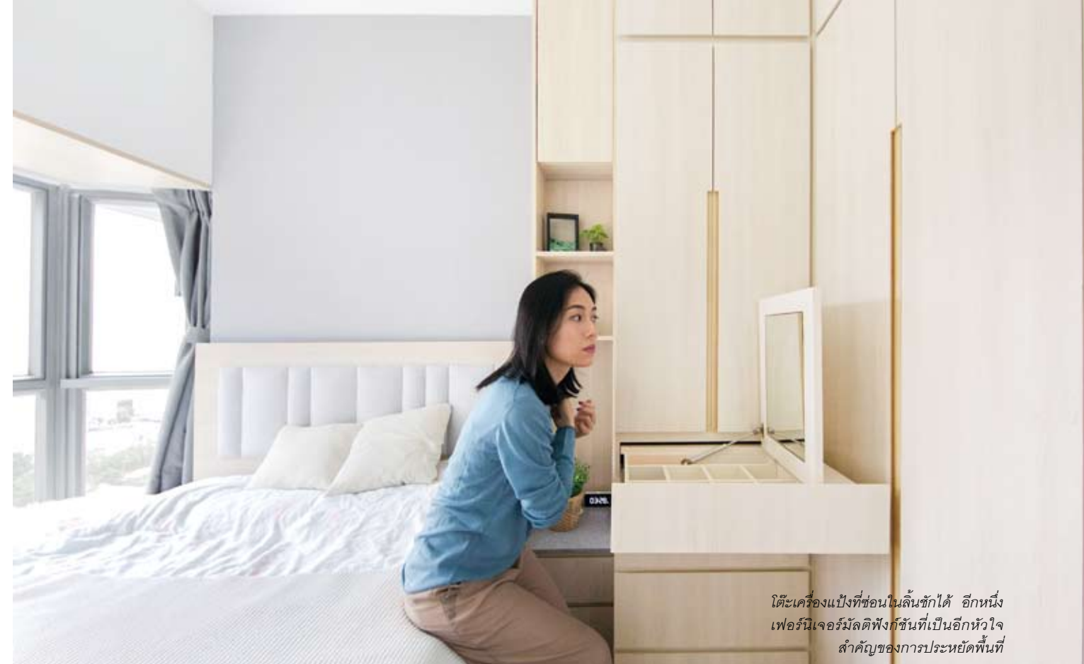
โต๊ะเครื่องแป้งที่ซ่อนในลิ้นชักได้ อีกหนึ่งเฟอร์นิเจอร์มัลติฟังก์ชันที่เป็นอีกหัวใจสำคัญของการประหยัดพื้นที่