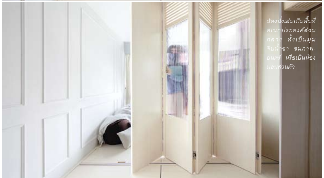
ห้องนั่งเล่นเป็นพื้นที่ อเนกประสงค์ส่วน กลาง ทั้งเป็นมุม จิบน้ำชา ชมภาพ- ยนตร์ หรือเป็นห้อง นอนส่วนตัว