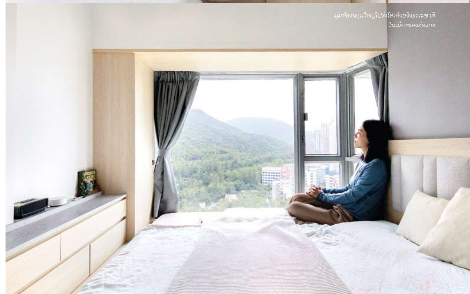
มุมห้องนอนใหญ่โปร่งโล่งด้วยวิวธรรมชาติในเมืองของฮ่องกง