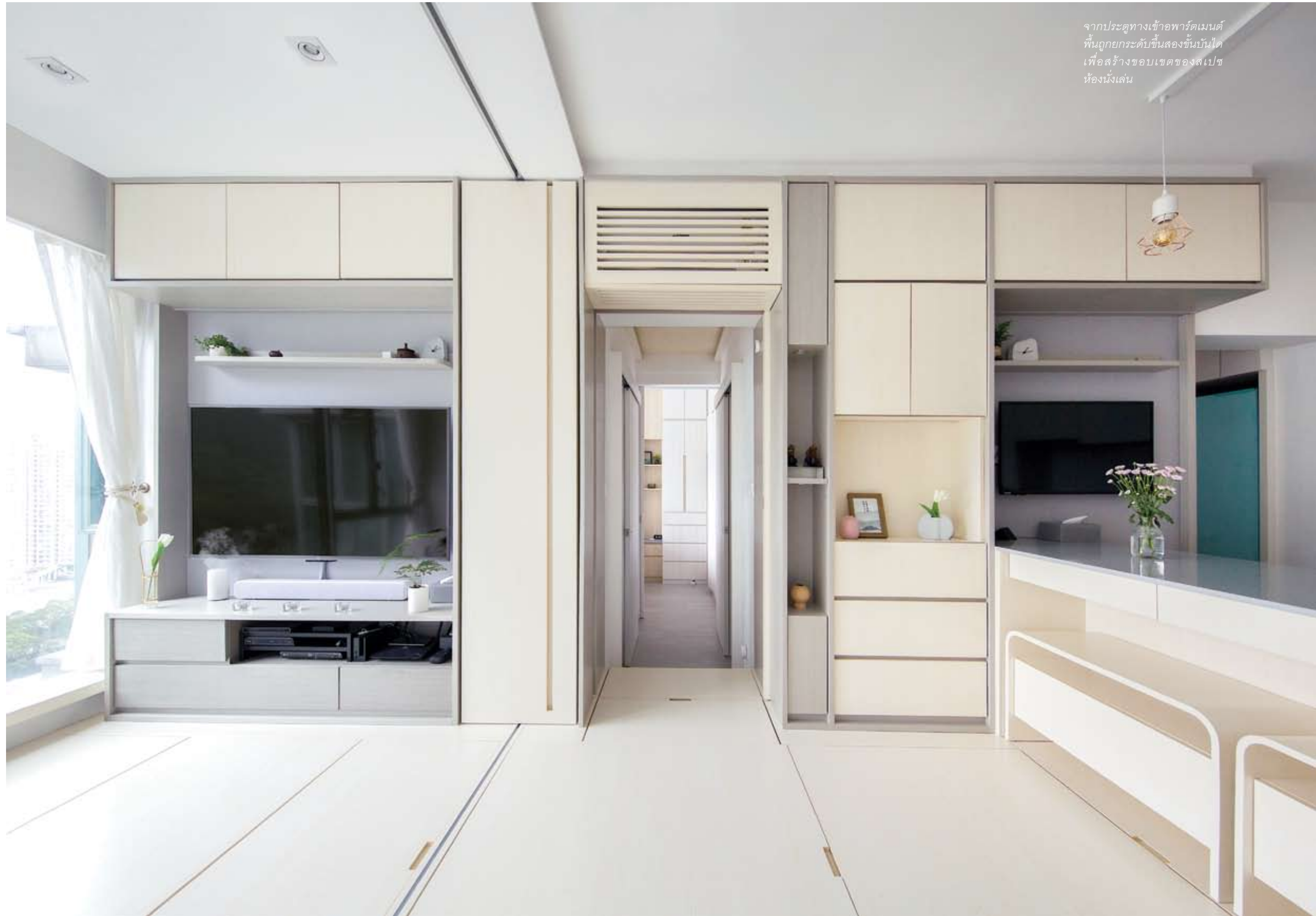
จากประตูทางเข้าพาร์ตเมนต์ พื้นที่ถูกยกระดับขึ้นสองชั้นบันได เพื่อสร้างขอบเขตของสเปซ ห้องนั่งเล่น

Smart Zendo เป็นอีกหนึ่งข้อพิสูจน์ของการออกแบบที่พยายามเอาชนะข้อจำกัดของพื้นที่ ด้วยแนวคิดที่เรียบง่ายแต่แฝงด้วยความคิดซึ่งในทุกรายละเอียด จึงทำให้ตอบโจทย์การอยู่อาศัยในรูปแบบเฉพาะของแต่ละครอบครัวได้