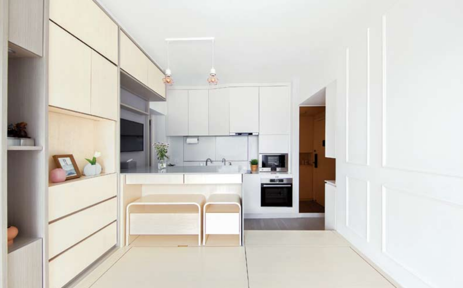
ในโครงสร้างพื้นที่ยกระดับใช้เป็นที่พักของได้ตลอดแนว ชุดโต๊ะเก้าอี้รับประทานอาหารออกแบบให้กะทัดรัด เลื่อนเก็บได้แบบประหยัดเนื้อที่ที่สุด