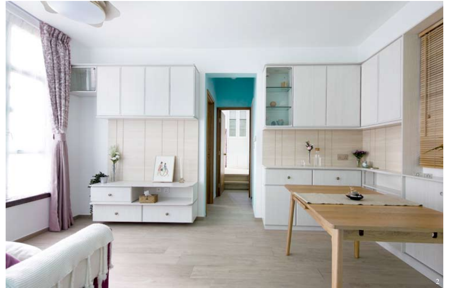
Furniture + Materials: 浴室瓷磚及潔具 / TOTO